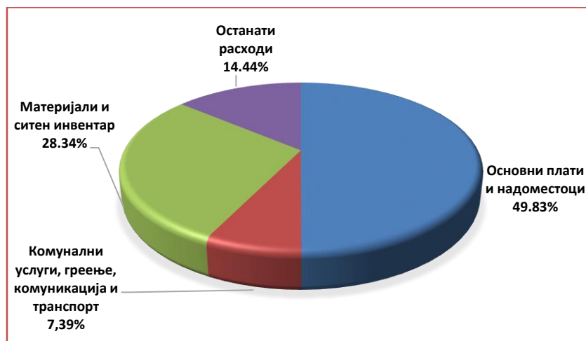
Графички приказ на структурата на реализирани расходи на ЈЗУ во период 01.01-31.05.2018 година